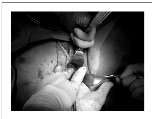
Photos 1 et 2 - Identification de la rupture